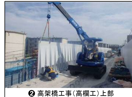
② 高架橋工事(高欄工)上部