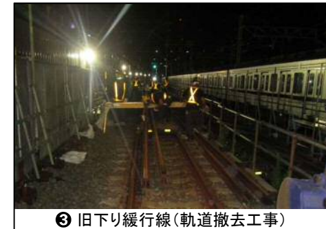
③ 旧下り緩行線(軌道撤去工事)