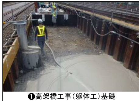
① 高架橋工事(躯体工)基礎

○騒音・振動の抑制に努めるとともに、事故のないよう安全第一で、工事を進めてまいります。