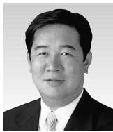
たきがみ 明 議員