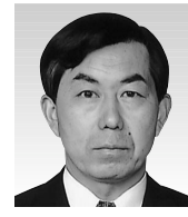
高山 延之 議員

【答】小・中学校合わせ計11校から申込があり、各校長から直接説明を受けたところである。内容は、地域の人材を活用した英語教育の充実を図る事業や、河川浄化を目的とした環境教育を目指す事業等がある。