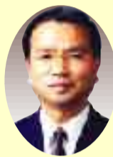
副議長 芦川 武雄