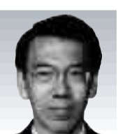
淵上 隆 議員