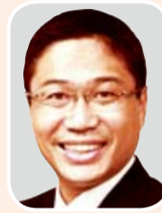
自由民主党 金田 正 議員

【問】 河川空間利用の先進都市である広島市では、国土交通省の「河川利用の特例措置」を活用し、水辺の開放感を享受できる「水辺のオープンカフェ」 【都市建設】 スカイツリーの効果や墨田区、江東区で計画している舟運の状況を調査するとともに、区の観光拠点との連携の可能性を研究していく。 【問】 河川空間利用の先進都市である広島市では、国土交通省の「河川利用の特例措置」を活用し、水辺の開放感を享受できる「水辺のオープンカフェ」