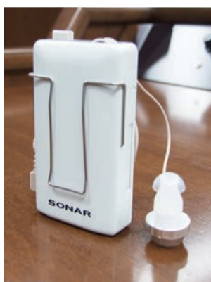
▲磁気ループ専用受信機