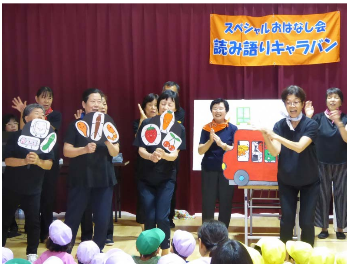
スペシャルおはなし会 読み語りキャラバン