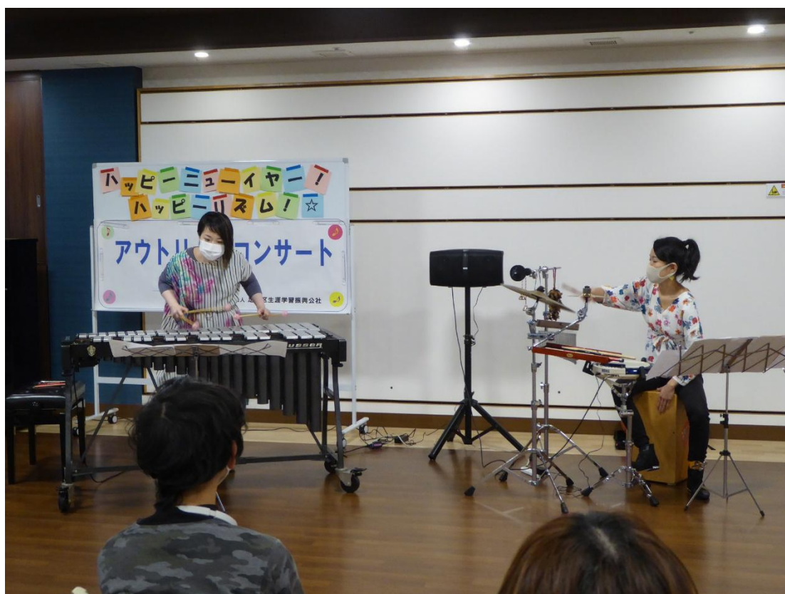
子どもの未来応援アウトリーチコンサート