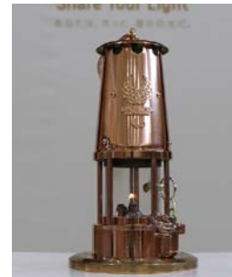
【聖火リレーランタン】