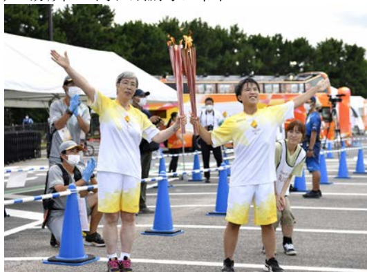
【点火セレモニーの様子】