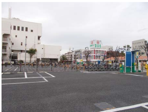
4 (旧) 教育相談センター