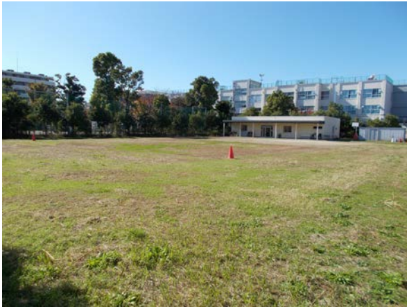
20 弥生小学校（拡張用地）