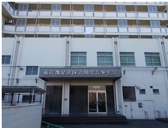
2 (旧) 勤労青少年寮