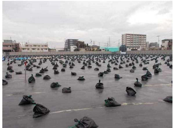
11 (旧) 上沼田中学校