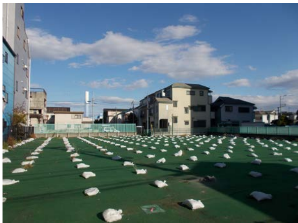
14 (旧) あすなる大谷田