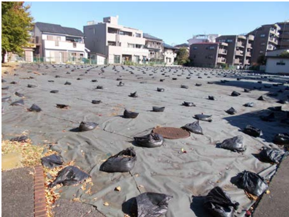
10 (旧) 中央本町プール