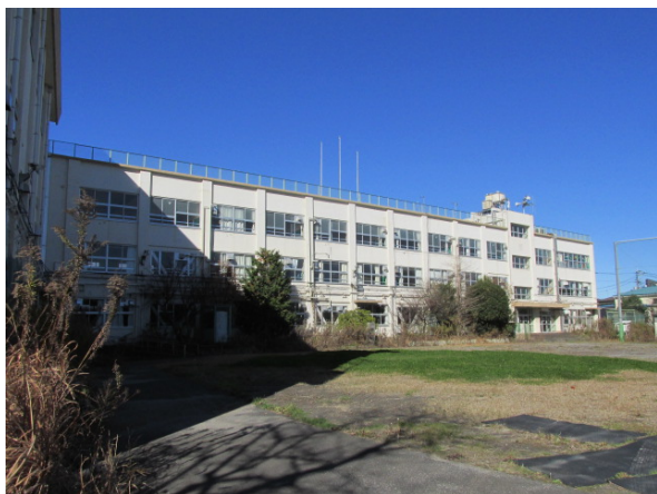
5 (旧) 本木東小学校