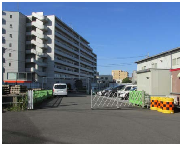
3 (旧) 竹の塚保健総合センター