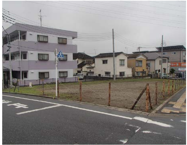
9 (旧) 毛長橋梁建設用地