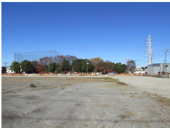
1 (旧) 入谷南小学校