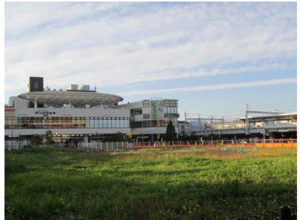
21 千住大橋駅周辺まちづくり用地