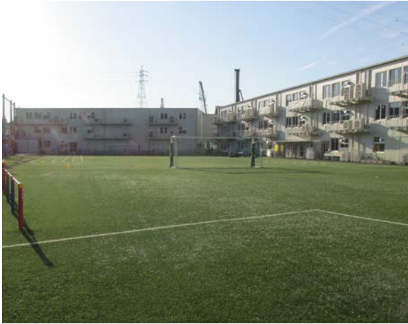
7 (旧) こども家庭支援センター