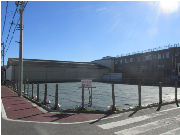
12 (旧) 江南区民事務所