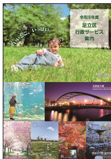
令和5年度 行政サービス案内（表紙）