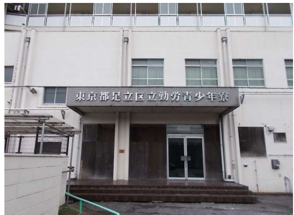
2 (旧) 勤労青少年寮