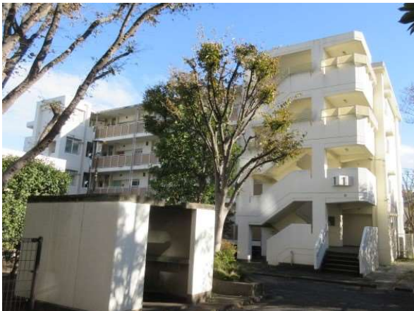
16 大谷田一丁目第2アパート