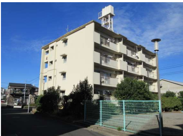
18-1 大谷田二丁目アパート (4号棟)