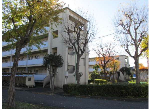
15 新田二丁目アパート