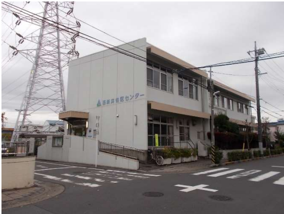
14 西新井住区センター