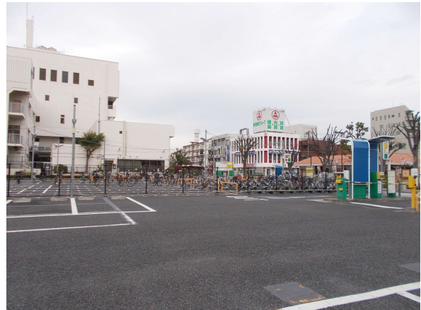
4 (旧) 教育相談センター