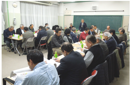
第2回綾瀬駅東口周辺地区まちづくり協議会の様子