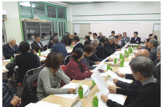
第1回綾瀬駅東口周辺地区まちづくり協議会の様子