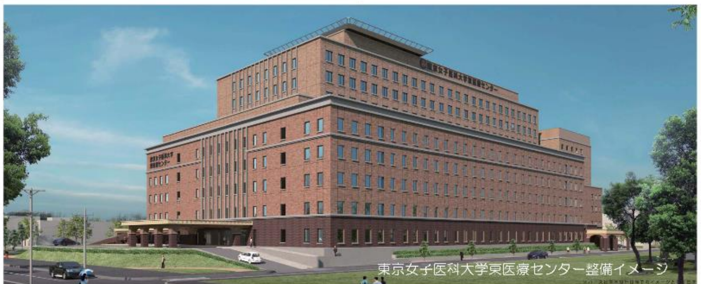
東京女子医科大学東医療センター整備イメージ