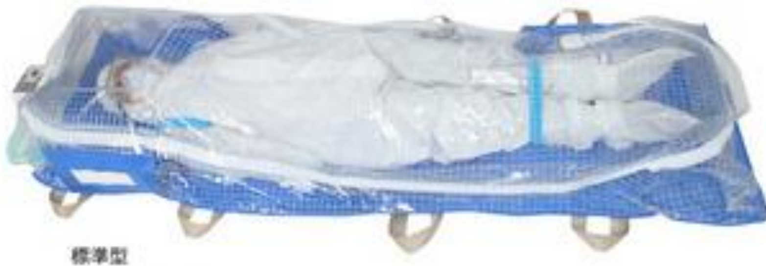
アイソレーター 参考写真