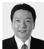
吉岡 茂 議員

【問】有事3法案は5月15日に衆議院を通過し、6月6日に参議院で可決・成立した。衆議院を通過する際には、1年以内に国民保護法制を整備することなどを盛り込んだ付帯決議が可決された。有事の際、国民を保護する上で、区の役割はどのようなものがあるのか何う。