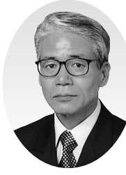
野中 栄治 議員

当選7回、危機管理対策調査特別委員会委員長、総務委員会副委員長、区民委員会副委員長、行政改革調査特別委員会副委員長を歴任。