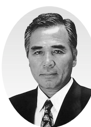
田中 章雄 議員

当選7回、議長、議員選出監査委員、議会運営委員会委員長、総務委員会委員長、厚生委員会委員長、予算・決算特別委員会委員長を歴任。