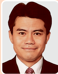
民主党 米山 やすし 議員

【土木】都に対し公園の利用促進を図るための様々な要望をしてきたが、今後も実現可能なものについて強く要望していく。