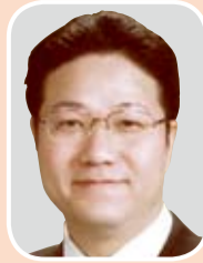
公明党 岡安 たかし 議員