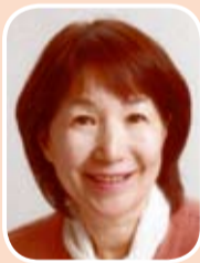
日本共産党 浅子 けい子 議員