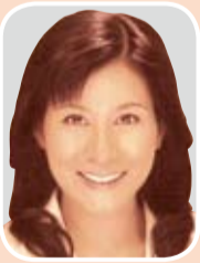
民主党 長谷川 たかこ 議員