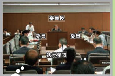
特別委員会の様子

前号では各委員会に所属する委員をご紹介しますが、ここでは各委員会の所管(調査事項)と、今定例会中に開かれた委員会での報告事項の一部を掲載し、活動をご紹介します。