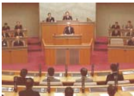
第2回臨時会のようす