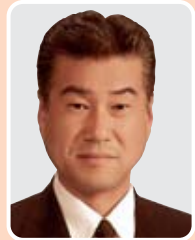
公明党 たがた 直昭 議員

【問】六町駅周辺の住民の方は、かねてより駅前交番の設置を念願されている。警視庁が人員対策に苦慮していることは十分承知している。地域の安全と安心のため、区としてもさらに強く働きかけていくべきと考えるが、区の見解を伺う。