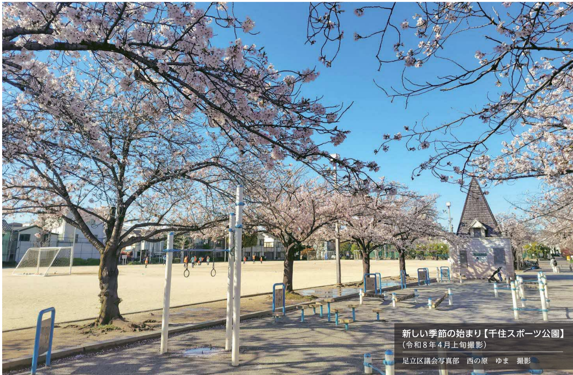
新しい季節の始まり【千住スポーツ公園】 (令和8年4月上旬撮影)