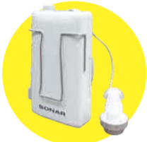
磁気ループ専用受信機