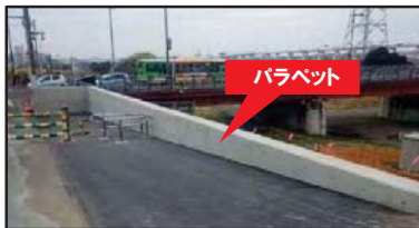
パラペット完成後のイメージ