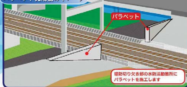
堤防切り欠き部の水防活動箇所にパラペットを施工します

発注者 国土交通省 関東地方整備局 荒川下流河川事務所 小名木川出張所 TEL:03-3681-6131 施工者 大勝建設株式会社 TEL:03-5878-6435