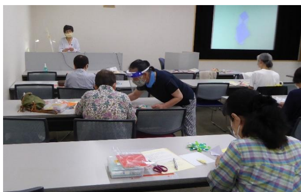
おりがみサポーター交流会Ⅰ