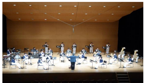
足立ジュニア吹奏楽団 卒団式