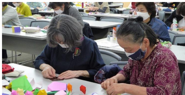
おりがみサポーターレベルアップ講座