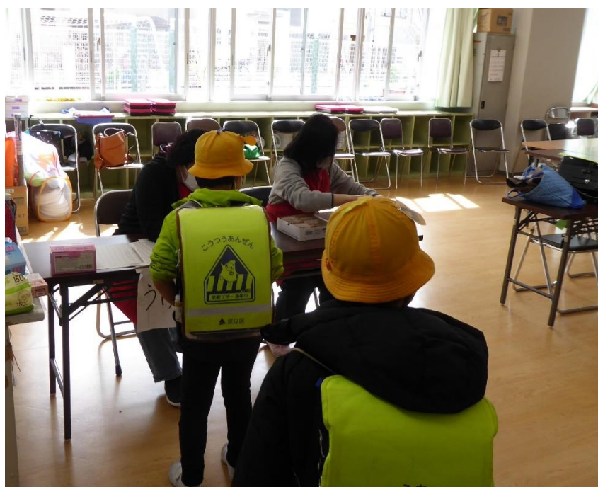
放課後子ども教室 受付の様子