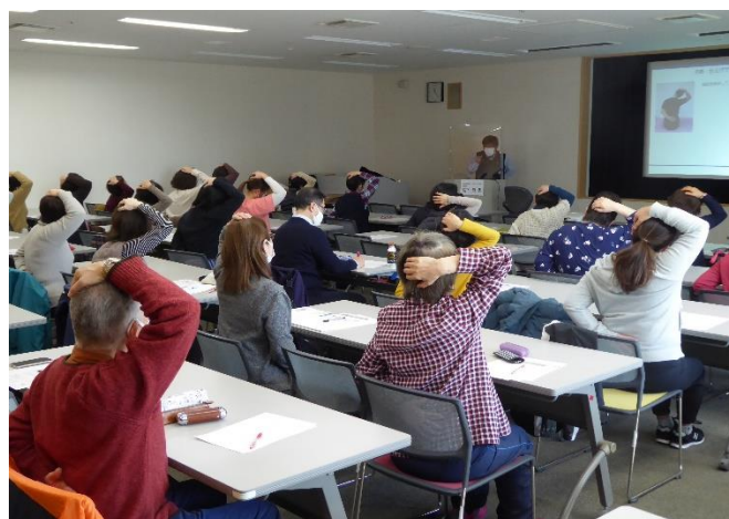
あだちウェルネスカレッジ