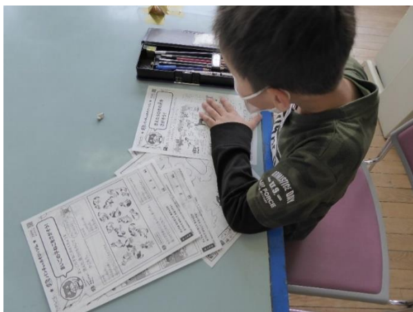
(5) 体験プログラム 遊びながら学べるプリント