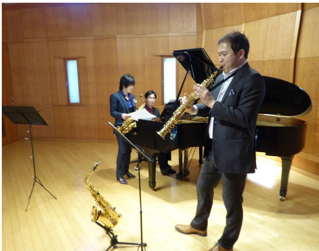
コンサート in ミュージアム わたなべ音楽堂 <ベルネザール>