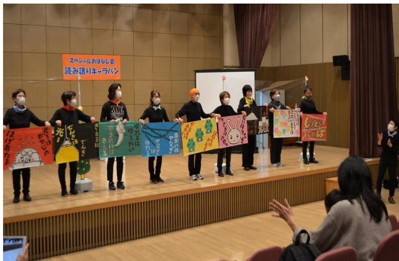
読み語りキャラバン隊によるおはなし会