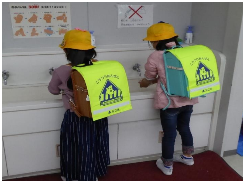
放課後子ども教室の感染症対策（手洗い）