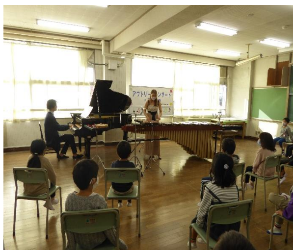
小学校アウトリーチコンサート