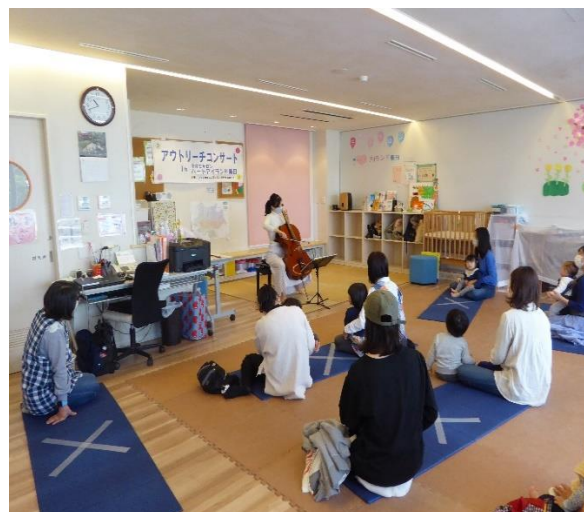
子どもの未来応援アウトリーチコンサート