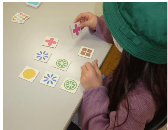
(9) 体験プログラム ボードゲーム