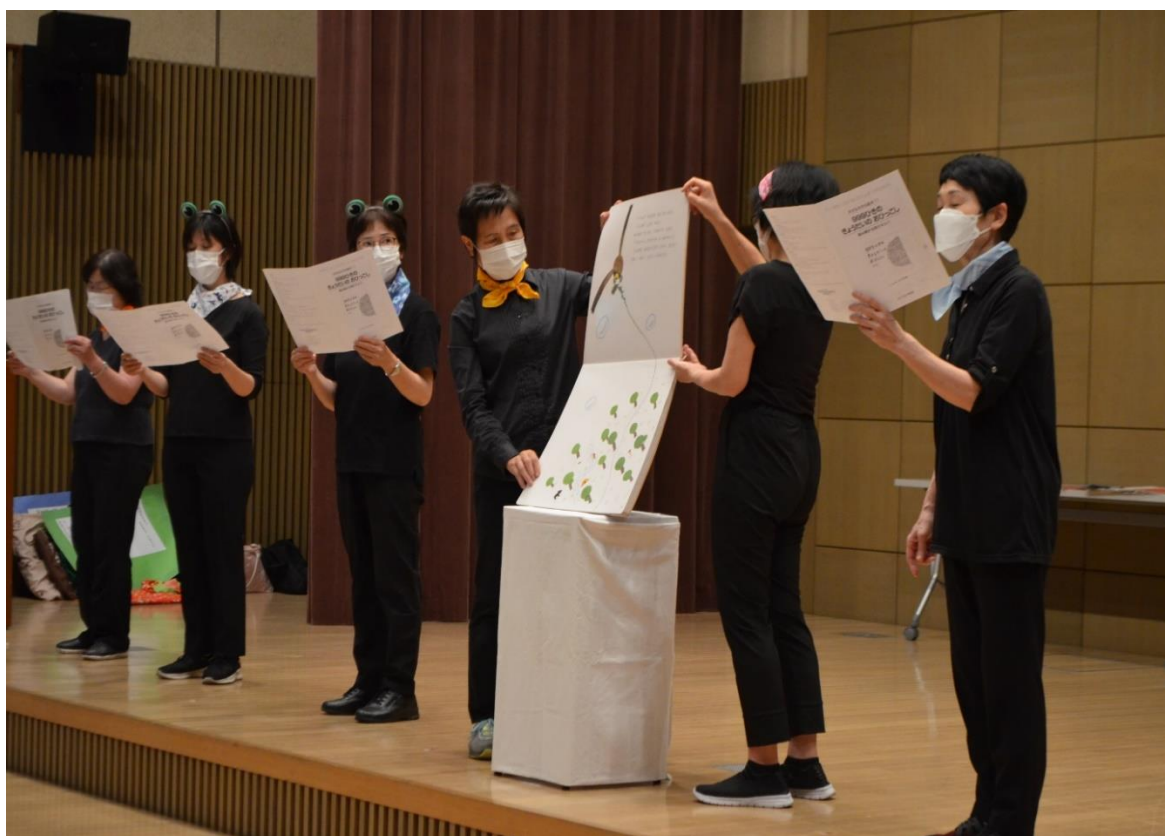
読み語りキャラバン in 学びピア 21