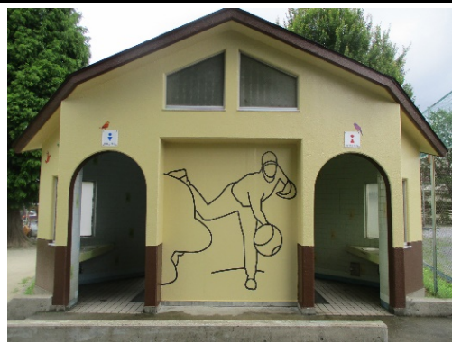
足立富士見公園（西新井 7-17-1）