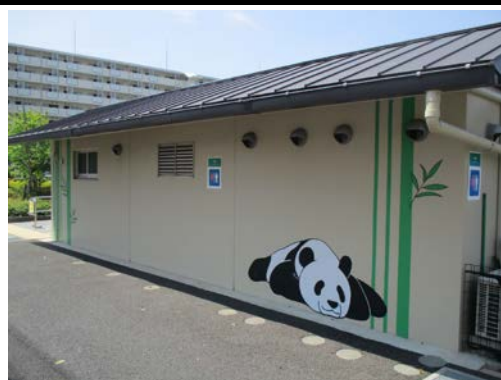
江北平成公園（江北 4-16-1）