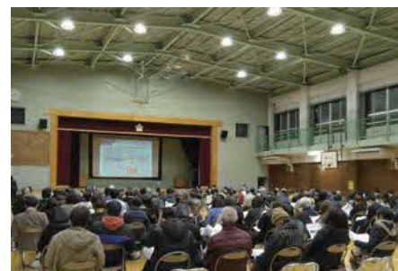
千寿第八小学校で12月22日に開催した本計画（案）説明会の様子

説明会の配布資料及び説明動画、質疑応答などの記録は、足立区ホームページ上の「千住大川端地区のまちづくり」でご覧いただけます。