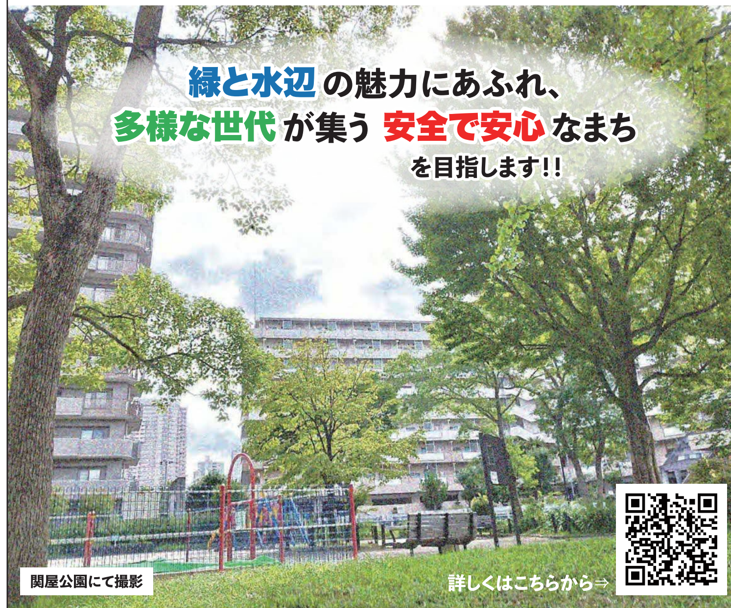
関屋公園にて撮影

緑と水辺の魅力にあふれ、 多様な世代が集う 安全で安心 なまち を目指します!!