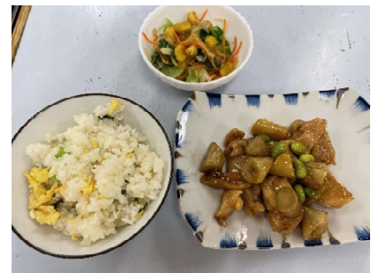
チキンチキンごぼう&小松菜のごはんとサラダ

文教大学の子ども食堂「ぶんこ食堂」を運営する学生の思いから生まれたレシピと足立区産の小松菜“あだち菜”を詰め込んだコラボ弁当2種を、区管理栄養士も監修し商品化。11月中、東武ストア全店舗(区外含め)で販売した。