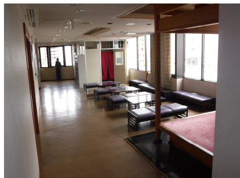
▲エレベーターからホール入口