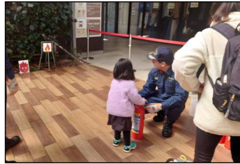
【消防署・消防団による体験ブース】 初期消火の体験やAEDの使用方法を通じて救急救命を学ぶ