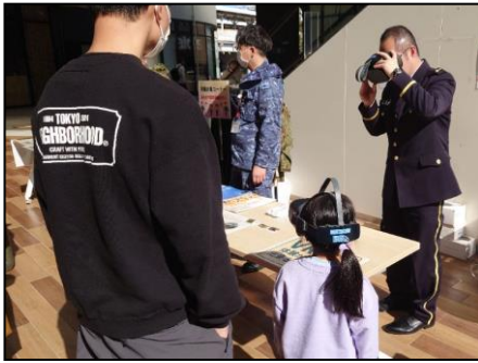
【自衛隊による体験ブース】 自衛隊が災害時に使用する物を見て・触れて・VRで体験