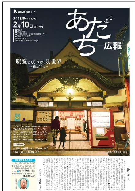
「あだち」広報2月10日号

平成30年度東京都広報コンクールでは、「広報紙部門」でも「あだち広報」平成30年2月10日号が最優秀を受賞した。