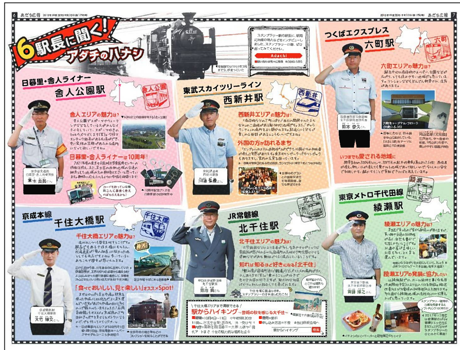
「あだち広報」9月10日号