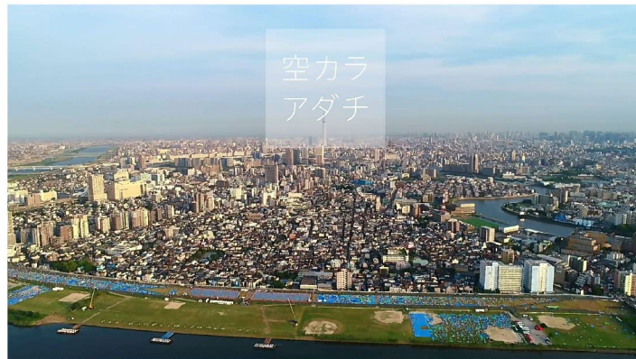
千住のまちなみ（オープニング映像）

配信開始後、NHK、読売新聞等のマスコミ各社に取り上げられ、5月末現在、「動画 de あだち」において約6,000回視聴されている。