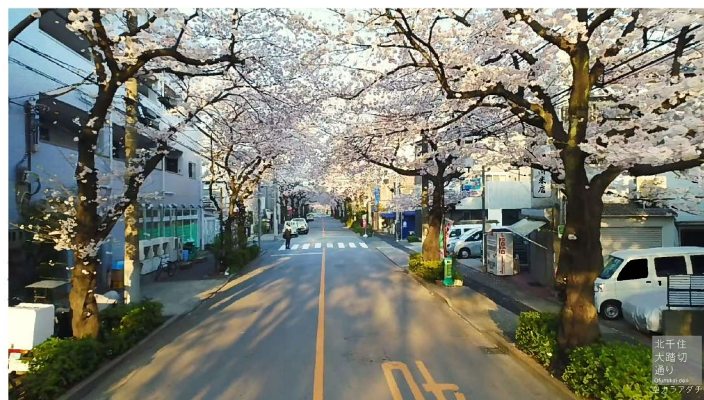
北千住「大踏切通り」の桜並木